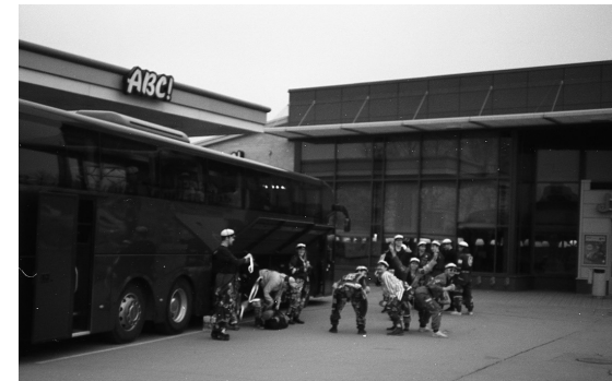
Kuva 2: Jalasjärvi sei teekkarit leikkisälle mielelle.

Yhdeksän jälkeen saavuimme ensimmäiselle taukopaikalle Jalasjärven ABC-asemalle. Matkan hallitsevasta teemasta tietämättöminä pidimme excursion historialliset ensimmäiset sitsit ravintolan pöydässä, allekirjoittanut tosin hieman happamana aamiaistarjoilun selektiivisyydestä. Alkossa ja supermarketissa vierailun jälkeen olimme henkisesti valmistautuneita vanhan emämaamme valloitukseen, joten kuskimme ohjasikin bussin nokan kohti Vaasaa (ruotsiksi Vasa).