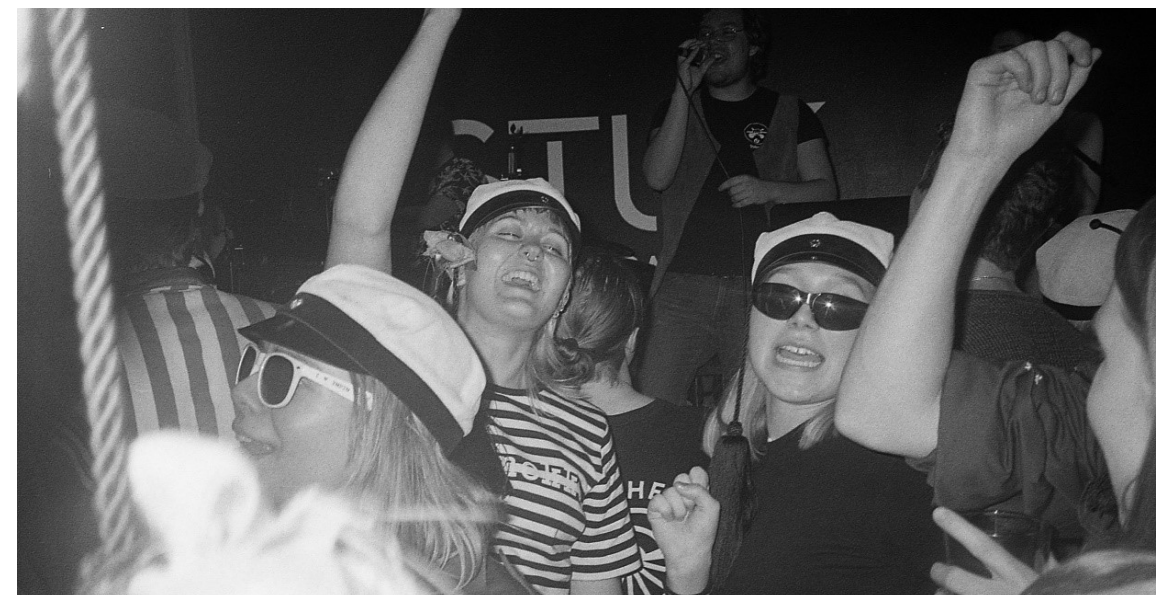
Kuva 8: Tupsufuksit näyttämässä, miten keikoilla kuuluu vetää.