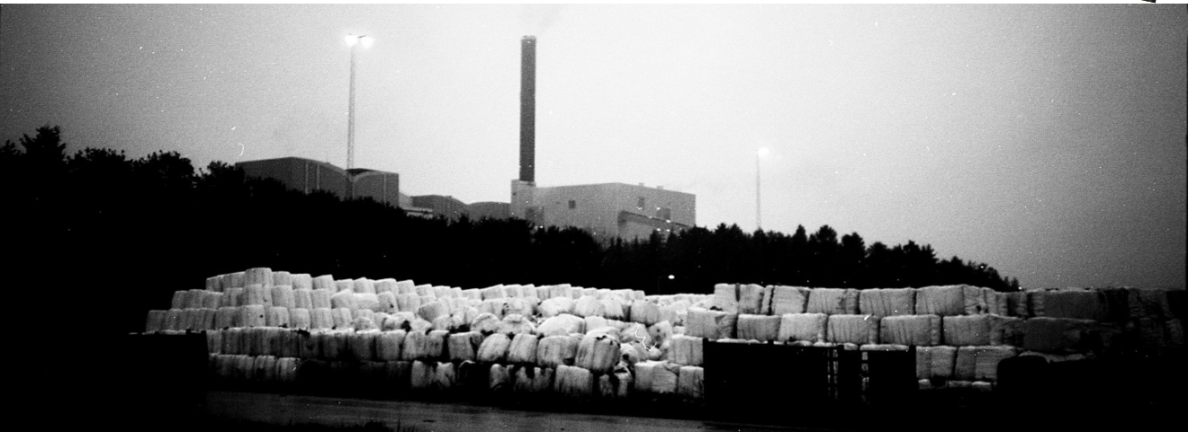
Kuva 6: Vanha kunnon polttolaitos.

Alkuvaikeuksien jälkeen sitsit ruotsalaisten kanssa kuitenkin luistivat mainiosti, ja uusia sitsikäytänteitä oli kiinnostavaa seuraila. Yön jatkohteina olivat ruotsalainen sauna, sekä paikallisten opiskelijoiden kämppäbileet.