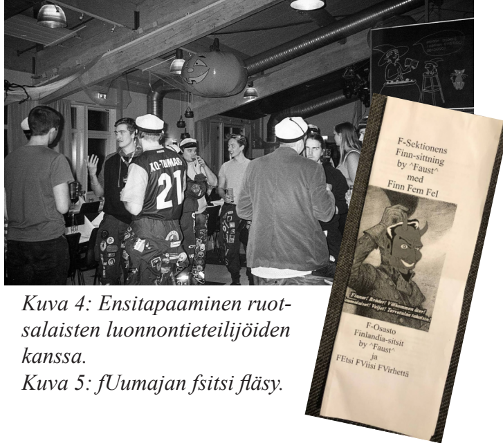
Kuva 4: Ensitapaaminen ruotsalaisten luonnontieteilijöiden kanssa.

Umeå Universitet:in kyljessä sijaitsevalle sitsipaikalle saavuttaessa ensikosketus ruotsalaiseen yhteiskuntajärjestykseen tuli heti narikassa. Omia alkoholijuomia ei saanut tuoda edes säilytykseen. Hätäratkaisuna bussilastillinen ykiläisiä jemmasi juomansa luonnollisesti roskakatokseen jätessäiliöiden taakse. Hervannassa oletuksena olisi ollut, että hiekatkin vietäisiin muovipussien pohjilta, mutta ilmeisesti paikallinen väestöjakauma oli hieman erilainen, sillä tippaakaan pulloista ei kadonnut.