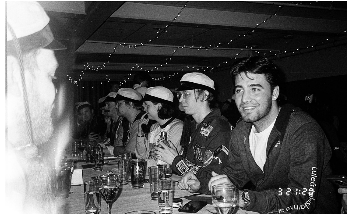
Kuva 7: Sitseillä ruotsalaiset diggailivat Raspun lauluja.

opiskelijabaari täynnä ihmisiä. Eikä kauaa mennytkään, kun tanssilattia oli reivaavien vihreähaalaristen valtaama. Illan aikana verkostoiduttiin ahkerasti, muutama onnelinen saattoi päästä käymään jopa paikallisella killalla.