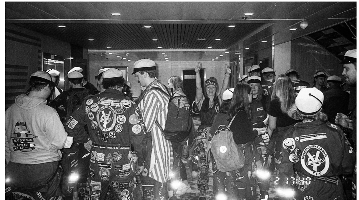
Kuva 3: Laivassa jännitettiin, löytyykö aamuyöllä tie Linux Leninille sekä muilla paikallisille opiskelijoille majoitukseen.

Laivassa Con te partirò raikasi ja saimme jännittäviä uutisia: Uumajassa meitä odottaisi paikallisten luonnontieteilijöiden järjestämät sitsit. Lisäjännitystä toi se, ettemme ennen sitsejä ehtisi laivan myöhästymisen johdosta majoittajiamme tavata, joten kontaktointi kämpille pääsemisestä tuli hoitaa etukäteen mobiililaittein. Tämä olikin monelle ensimmäinen odotettu mahdollisuus lämmitellä ruotsin kielen taitoja.