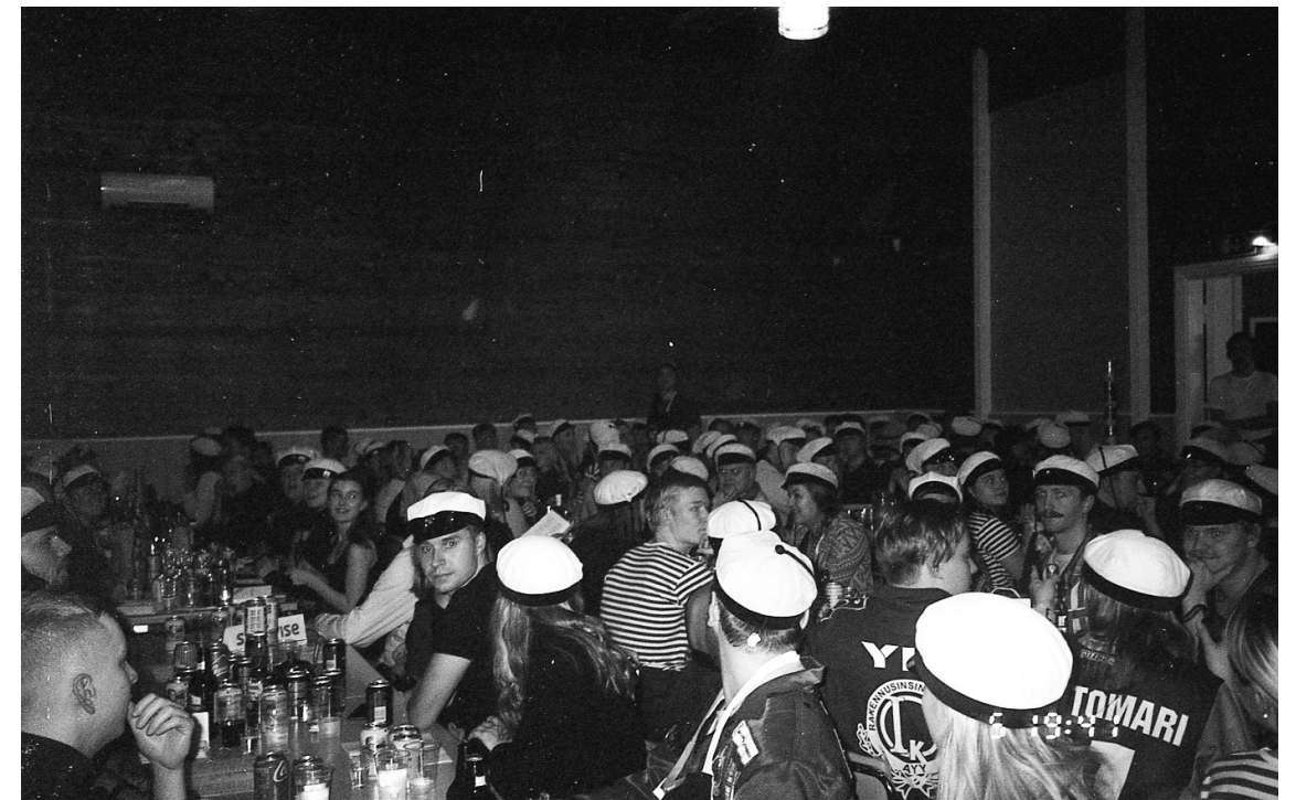
Kuva 10: Ensimmäiset Ympppipäivien sitsit kahteen vuoteen.

Näin excumuistoja verestellessä on vielä todettava, että kaikessa henkisessä ja fyysisessä rasittavuudessaan RankkaXQ tarjosi korvaamattoman virkistysloman, joka erityisesti keskellä synkkää syksyä tuli tarpeeseen. Isot kiitokset kovan työn tehneelle XQ-tiimille ja vahvat suositukset kaikille tulevia excuja ajatellen!