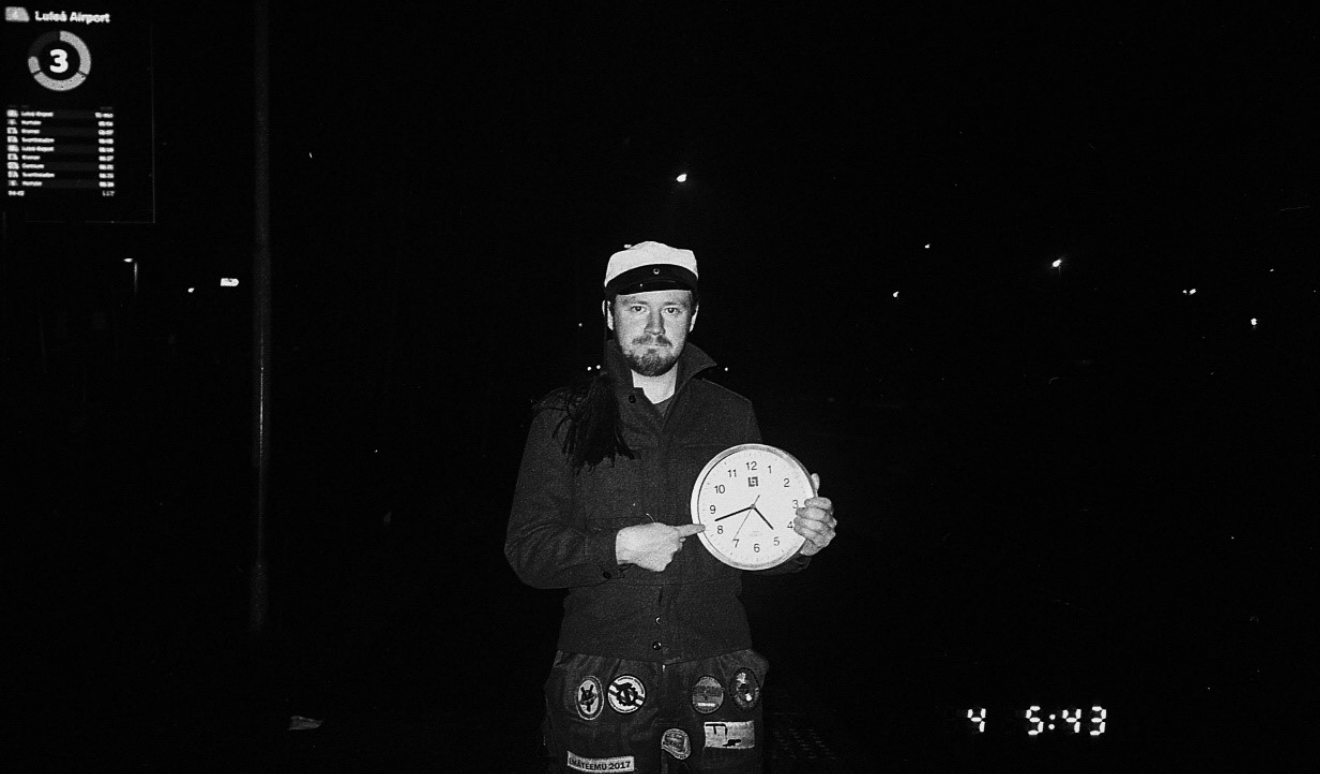
Kuva 9: Menisipä Luulajan yössä busseja. Ainakin mentiin ympäri.

Torstai-aamuna nautiskeltiin regeneroivia brunseja Luulajan keskustan tarjonnan parissa. Ajatus siitä, että seuraavaksi matkan kohteena olisi Oulun Ympäristöteekkaripäivät, oli vienoisesti kauhistuttava, mutta eteenpäin oli jatkettava.